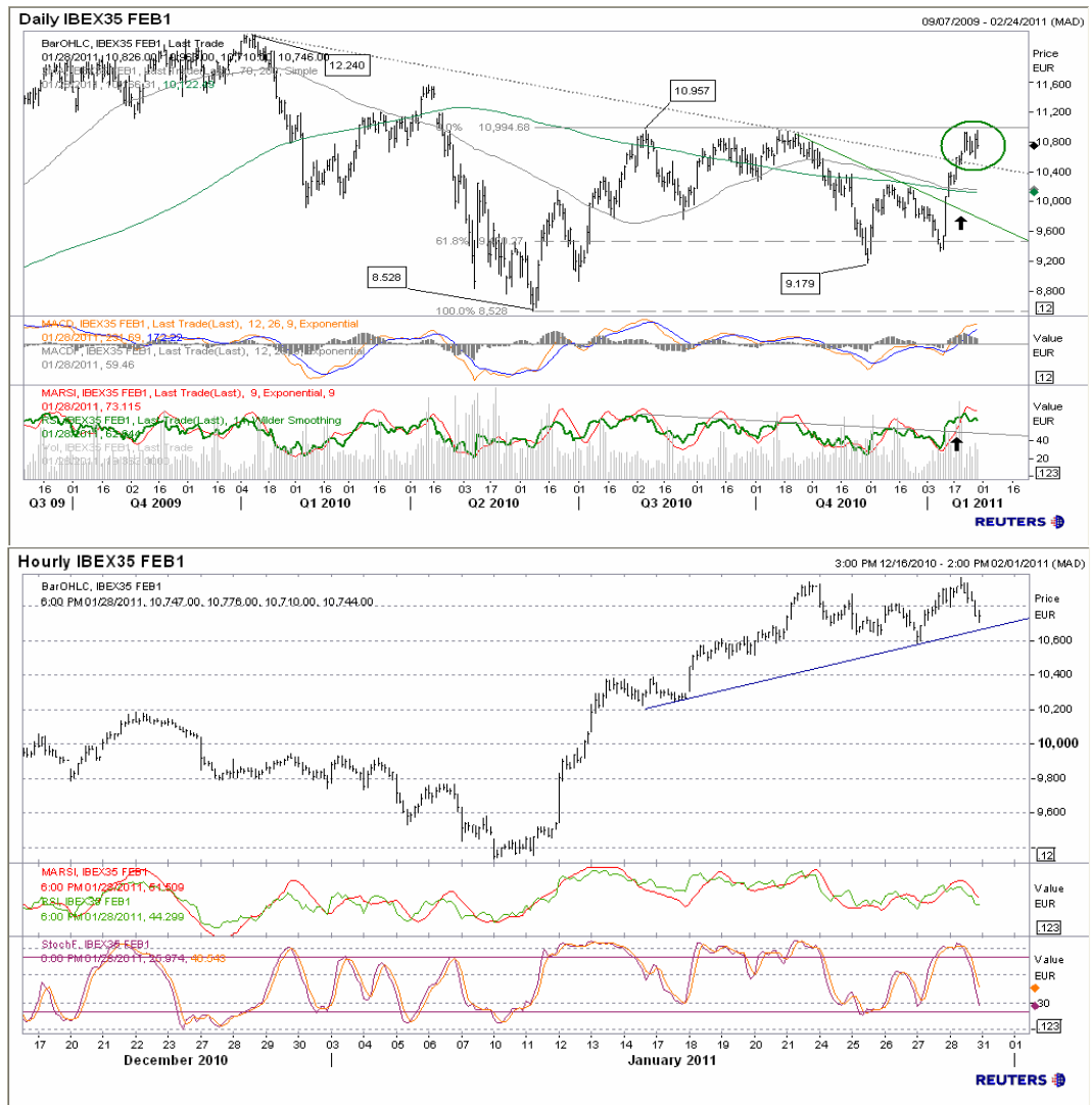
Futuro índice Ibx35 gráficos diario / horario.

En el gráfico horario entramos de nuevo en sobrecompra, que es donde los movimientos de subida suelen ser más agresivos. El punto clave de resistencia, 10.930-10.960 para continuar el movimiento de subida. Por la parte inferior, el recorte esperado hasta 10.200 se queda a medias, tras haber llegado a 10.578. De todos modos, bien rompiendo resistencia, bien en soporte principal 10.200, planteamos compras en el índice español.