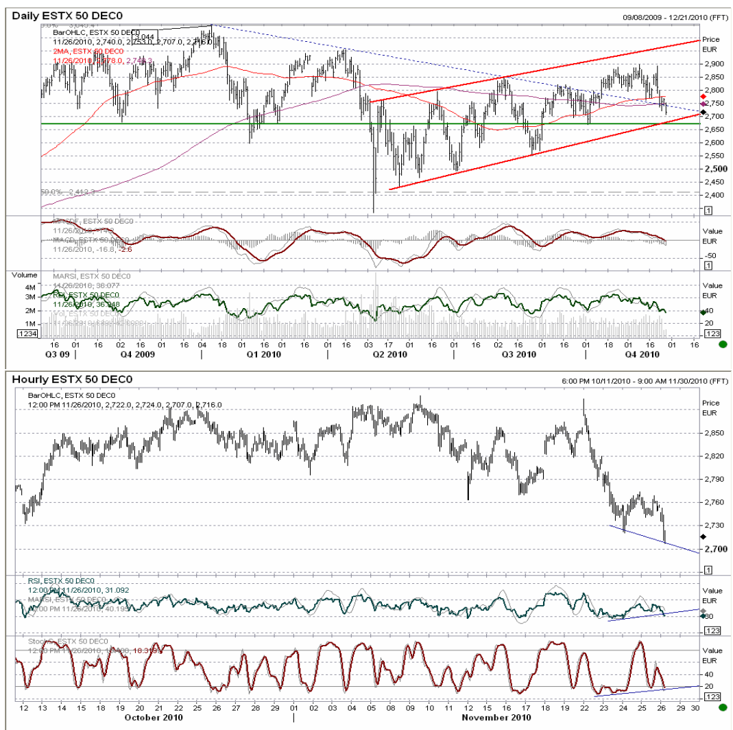
Futuro Eurostoxx50 gráficos diario / horario.

En el muy corto plazo empiezan a aparecer divergencias alcistas, aviso de rebotes, aunque hasta no superar 2.770 puntos no vemos claridad en los movimientos. La proyección de caída sigue situándose en 2.670 puntos, aunque de momento vemos difícil mayores caídas.