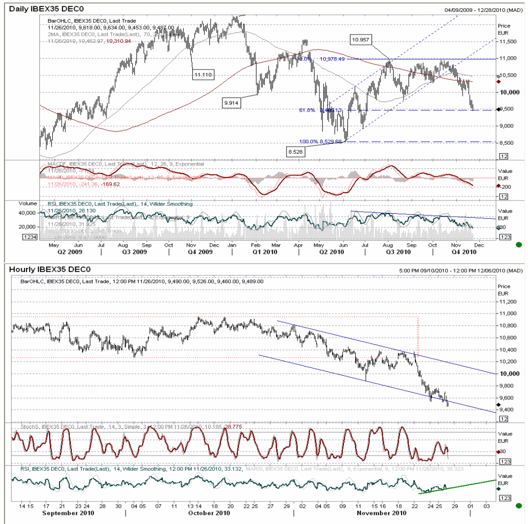
Futuro índice Ibox35 gráficos diario / horario.

En el gráfico de más corto plazo, la pérdida de 9.880 nos dejaba objetivo de caída 9.550 puntos, objetivo cumplido con creces. Divergencia alcista horaria nos hace suponer en un rebote ya cercano, aunque la volatilidad no deja ver claramente la situación. Objetivo de subida en 10.100 puntos en el techo del canal bajista en que se encuentra el índice.