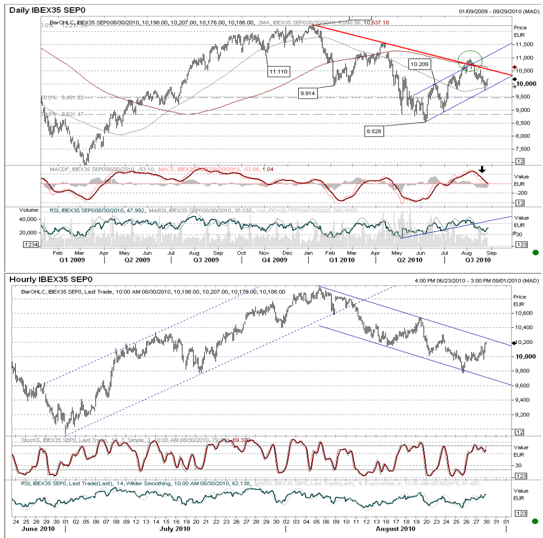
Gráfico del muy corto plazo: continúa su evolución dentro de un canal bajista con base 9.700 y techo 10.240. Los canales tienden a romperse en sentido contrario a su dirección, por lo que pensamos habrá ruptura de 10.240 y desarrollo hasta al menos 10.550. Romper el canal por la parte inferior supondría entrar en rally bajista. La falta de claridad nos hace dudar sobre el potencial movimiento de subida del índice español.

Futuro índice Ibex35 gráficos diario / horario.