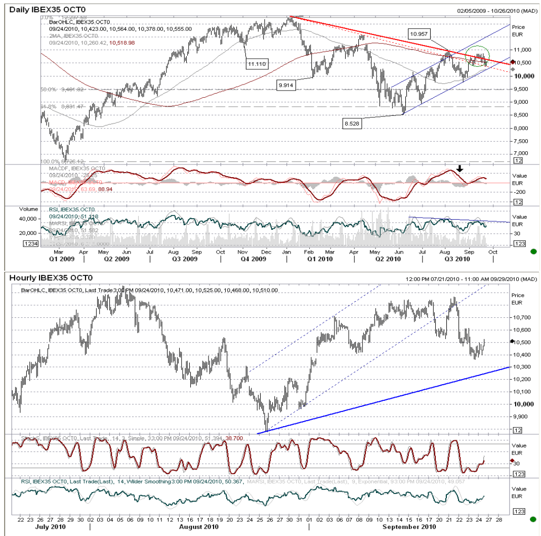
Gráfico horario: llegamos a primer objetivo 10.400, con rebote posible hasta 10.800 antes de continuar con el movimiento de caída. Sin divergencias alcistas, consideramos el movimiento actual incompleto, por lo que esperamos la pérdida de 10.400 buscando al menos 10.200 puntos.

Futuro índice Ibox35 gráficos diario / horario.