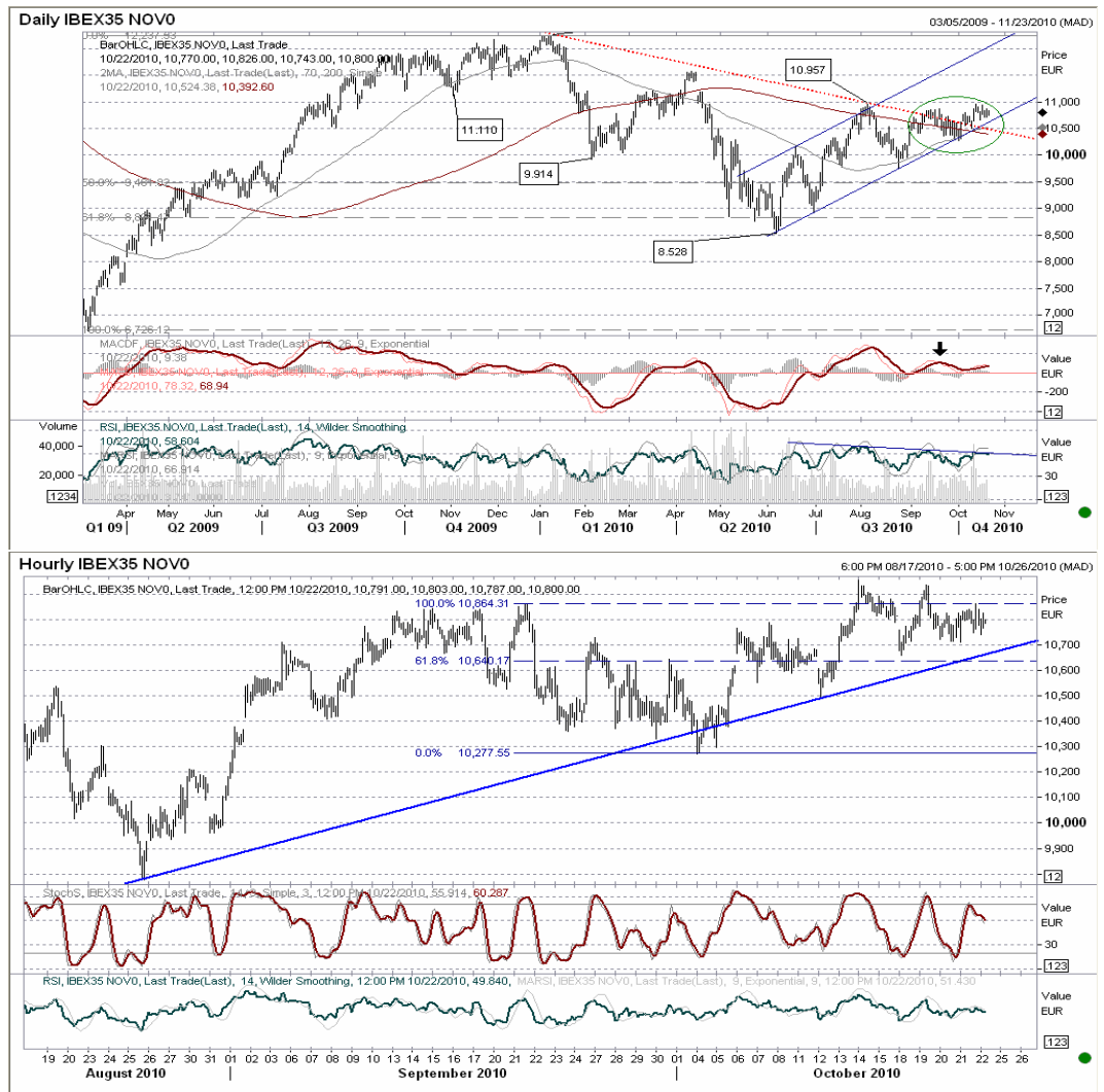
Gráfico horario: Superando 10.957, movimiento hasta 11.225. Perdiendo 10.660, vuelta a 9.800 puntos. Los indicadores y directrices siguen perdiendo validez dentro de la actual situación lateral.

Futuro índice Ibe35 gráficos diario / horario.