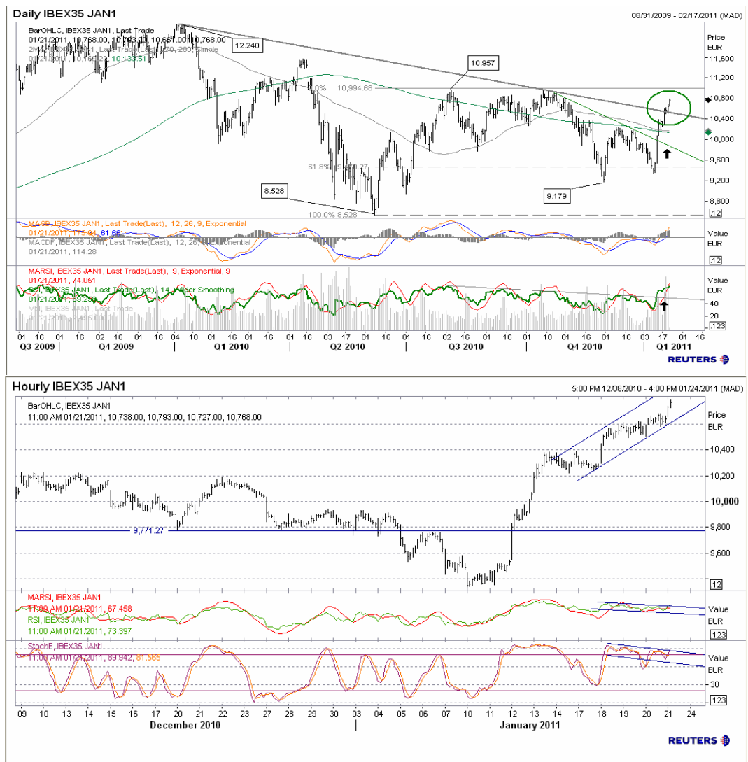
Futuro índice Ibx35 gráficos diario / horario.

En el gráfico horario encontramos una divergencia bajista desde el día 19 de enero, de momento sin haber realizado corrección ninguna, principalmente debido al fuerte cambio de sentimiento positivo para el índice español en estas dos últimas semanas. Aunque lo prudente sería esperar recortes antes de plantear compras direccionales.