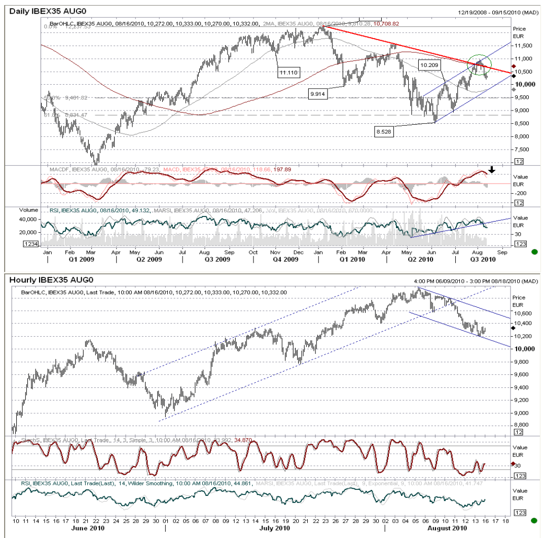
Gráfico del muy corto plazo: ruptura del canal alcista por la parte inferior, con primer nivel de desarrollo hasta 10.150. Rebote por divergencias alcistas de indicadores horarios hasta 10.550-10.600, y después de nuevo caídas hasta 9.700-9.800.

Futuro índice Ibex35 gráficos diario / horario. Fuente: Reuters / Santander Investment Bolsa