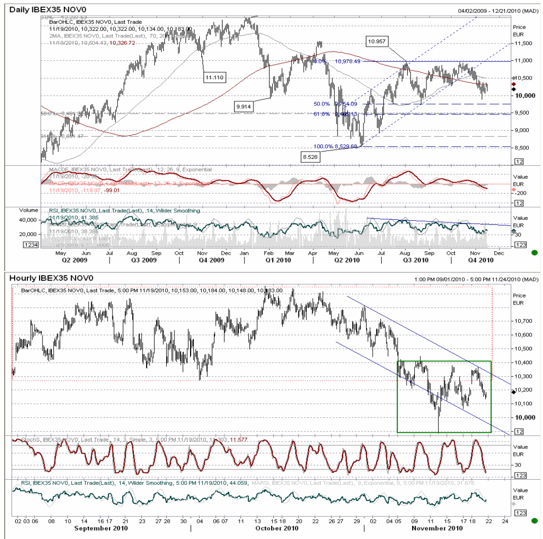
Futuro índice Ibx35 gráficos diario / horario.

En el gráfico de más corto plazo, figura de rebote con base 9.880 y techo 10.400, cuya ruptura por la parte superior nos dejaría en 10.920. Además, dibujamos un canal bajista de consolidación –en azul en el gráfico horario– con punto de ruptura 10.340, nivel de aviso a cambios más positivos de cara a final de semana. Un fallo en esta proyección nos llevaría a presionar para intentar romper el soporte 9.880 y continuar el movimiento correctivo bajista actual.