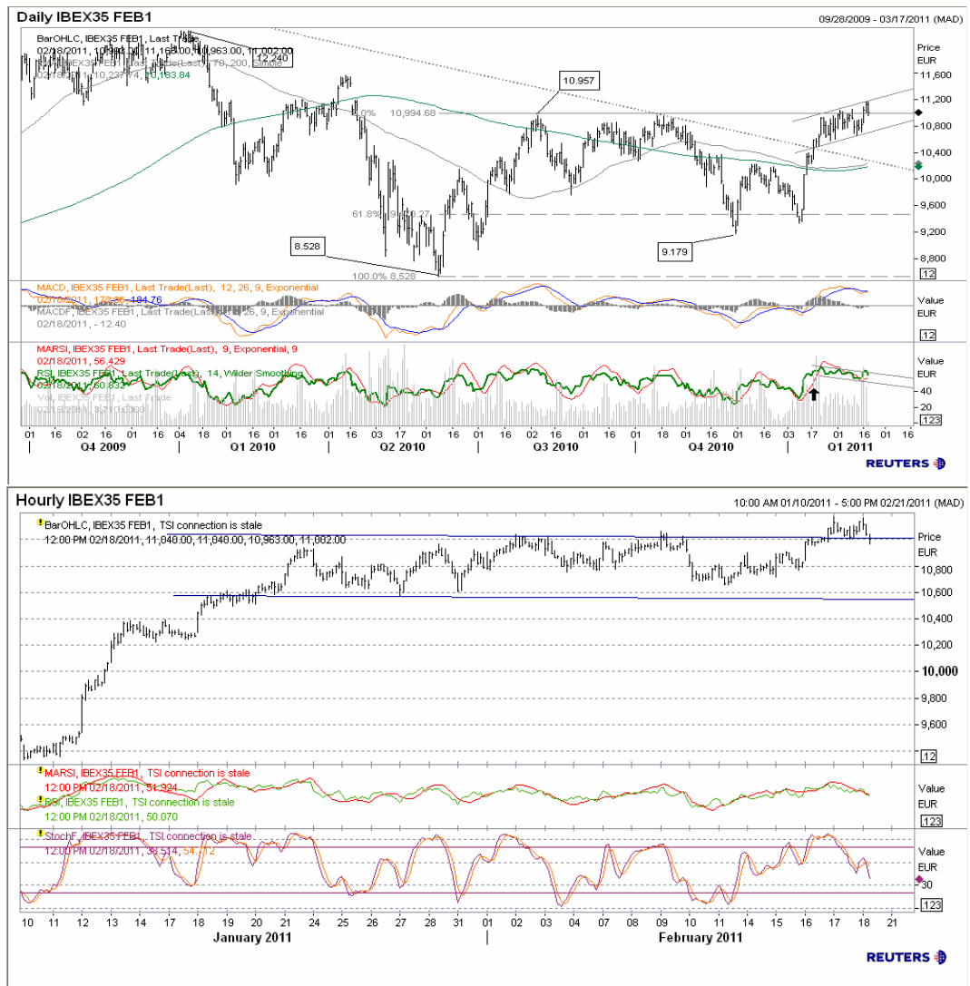
Futuro índice Ibx35 gráficos diario / horario. Fuente: Reuters / Santander Investment Bolsa

Por la parte superior, mantenemos objetivo en la media de 200 sesiones 11.500, aunque también insistimos que deberíamos volver a probar el soporte 10.200 antes de un cambio definitivo de la tendencia. Ese cambio tendría que venir con la aparición de un alto volumen de negocio, algo que de momento no vemos.