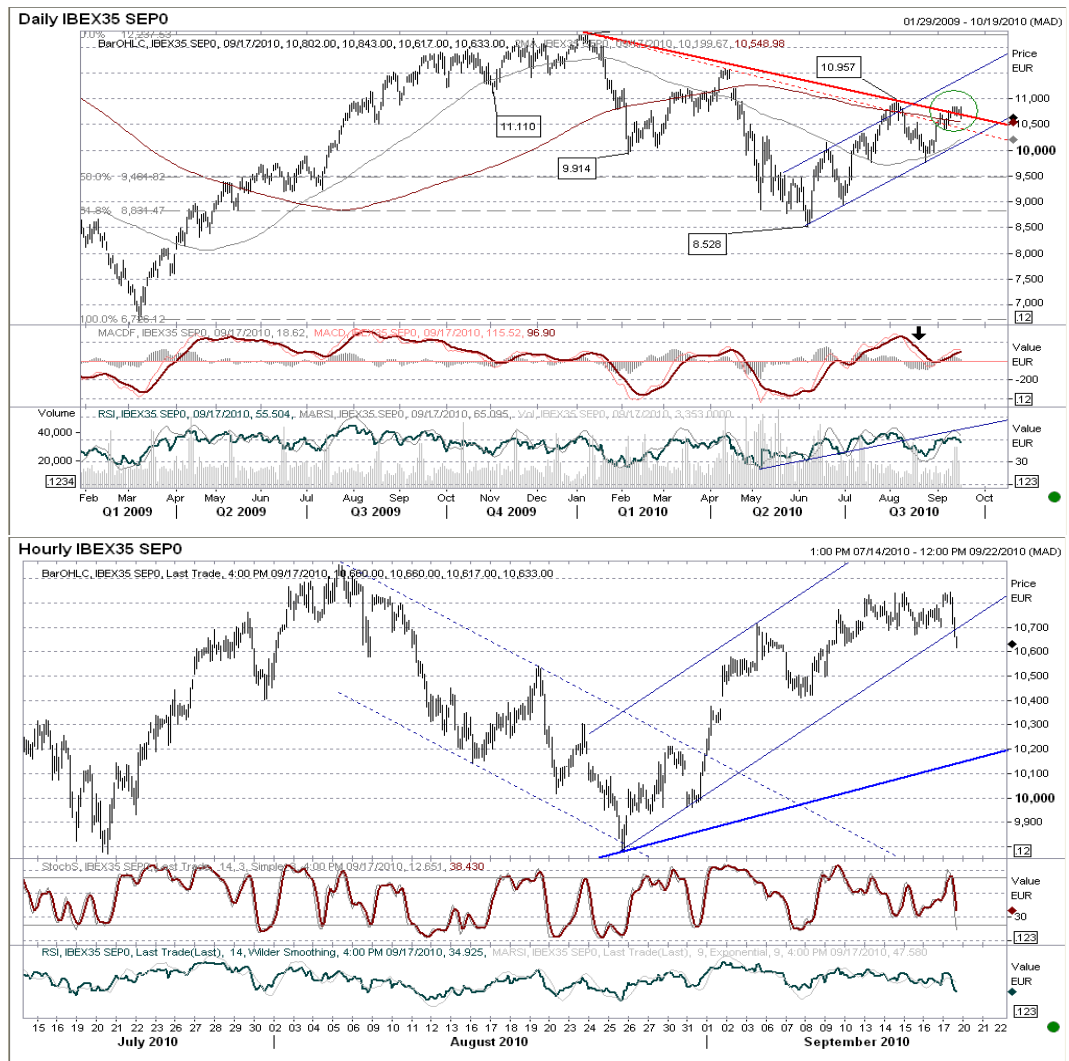
Futuro índice Ibox35 gráficos diario / horario.

Gráfico horario: rompemos canal alcista por la parte inferior después de haber cumplido objetivo 10.770 en la subida. Objetivos en la caída 10.400 – 10.150. De todos modos, stop a posiciones de venta en el máximo de la semana en 10.843, nivel cuya ruptura nos podría llevar en rally hasta 10.957.