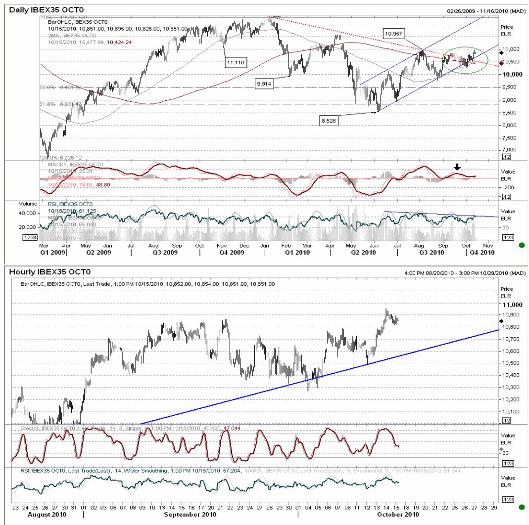
Gráfico horario: siguen sin aparecer divergencias bajistas que faciliten una corrección mayor. Interés únicamente rompiendo el rango del muy corto plazo, 10.957-10.300. Superando la resistencia, objetivo 11.225, perdiendo el soporte, 9.770.

Futuro índice Ibx35 gráficos diario / horario. Fuente: Reuters / Santander Investment Bolsa