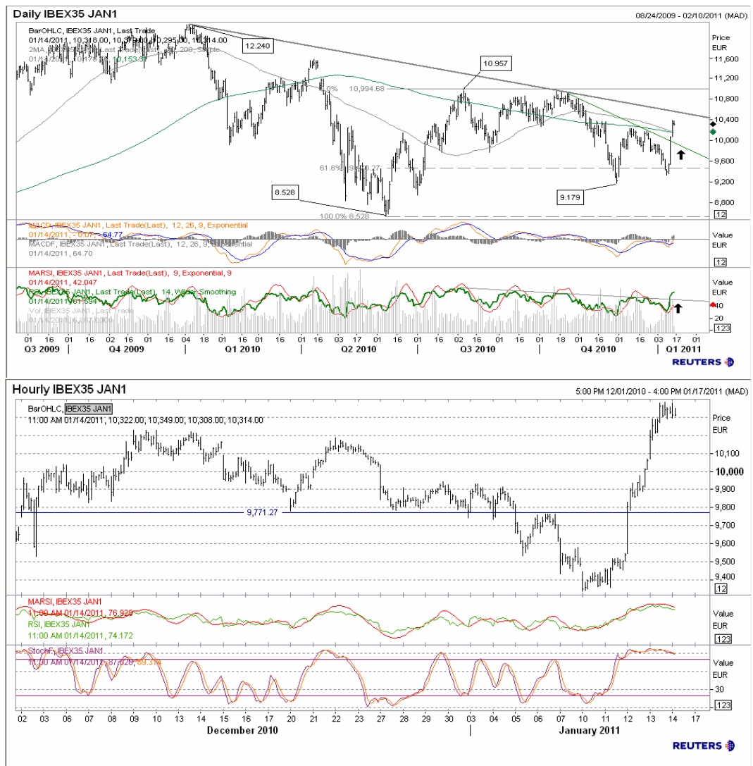
Futuro índice Ibx35 gráficos diario / horario.

En el gráfico horario entramos en zona de vfuerte sobrecompra con divergencias bajistas, por lo que parece veremos un movimiento correctivo antes de considerar objetivos de subida, aunque sí es cierto que el panorama negativo comienza a cambiar. Por la parte superior, rompiendo 10.580, siguiente nivel 10.957.