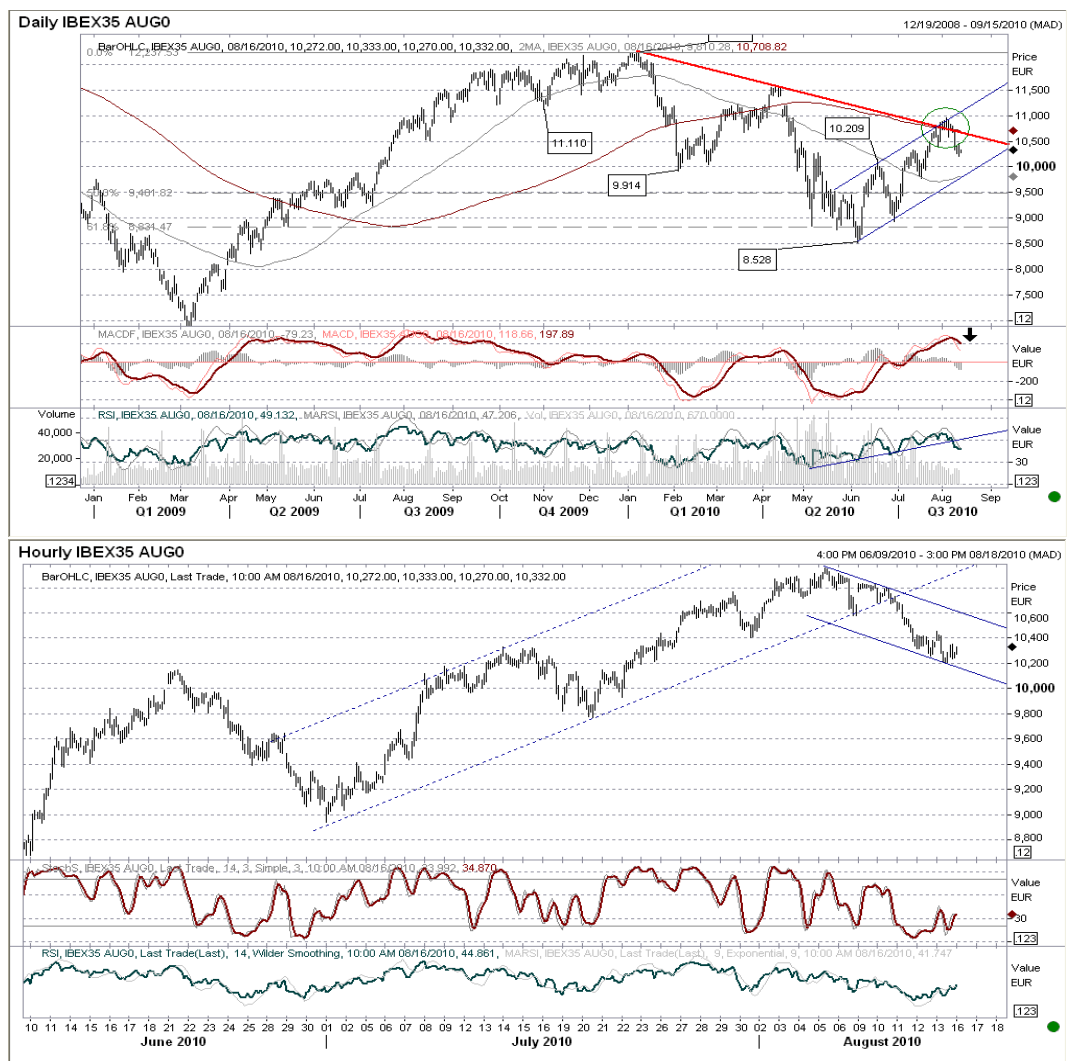
Futuro índice Ibx35 gráficos diario / horario.

Gráfico del muy corto plazo: ruptura del canal alcista por la parte inferior, con primer nivel de desarrollo hasta 10.150. Rebote por divergencias alcistas de indicadores horarios hasta 10.550-10.600, y después de nuevo caídas hasta 9.700-9.800.