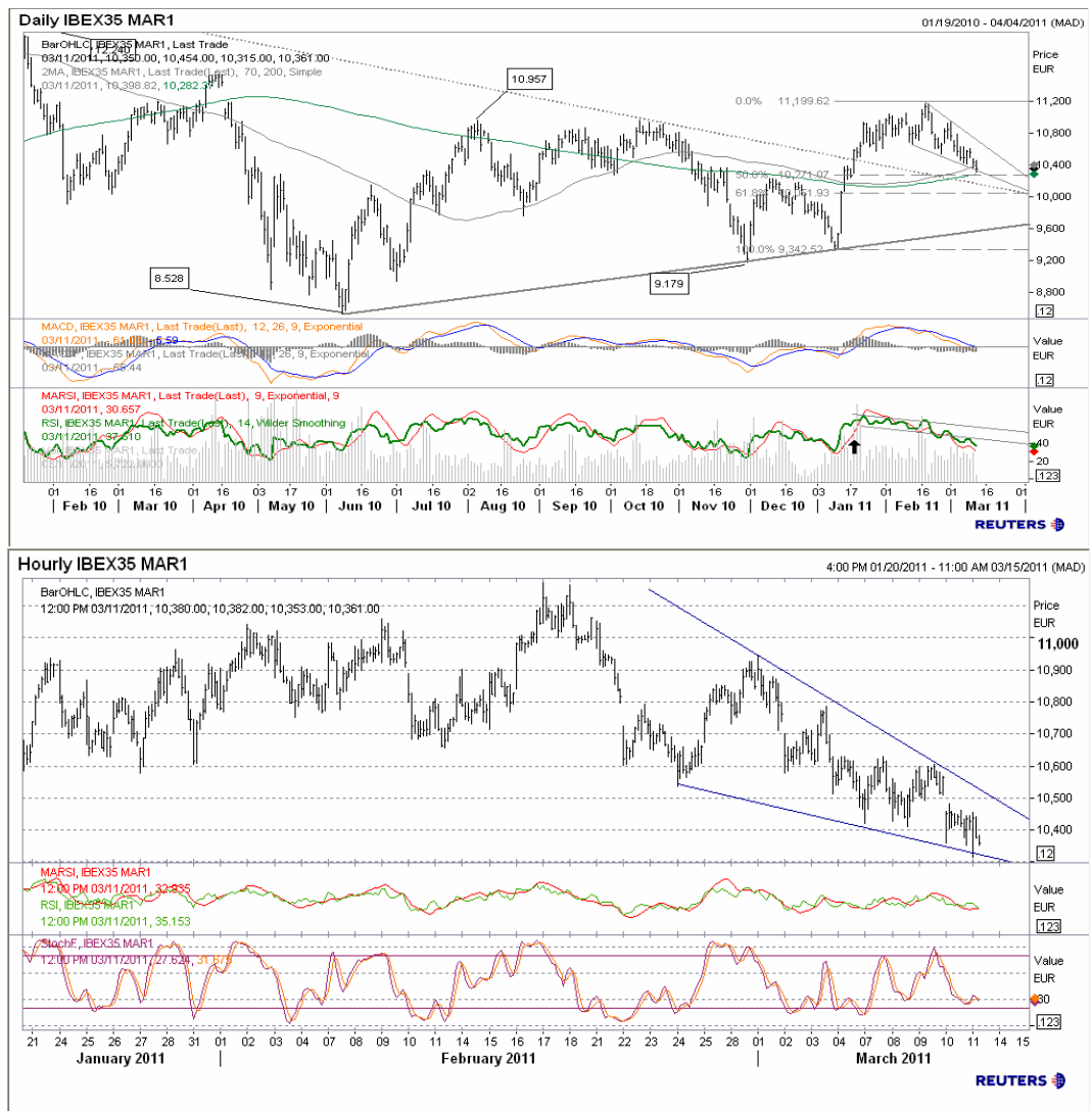
Futuro índice Ibx35 gráficos diario / horario.

De continuar los recortes, el 62% de la subida anterior lo situamos en 10.040, en donde sí plantearíamos ya abiertamente posiciones de compra. En el muy corto plazo somos todavía cautos por la falta de divergencias alcistas que nos hagan pensar en un rebote inmediato.