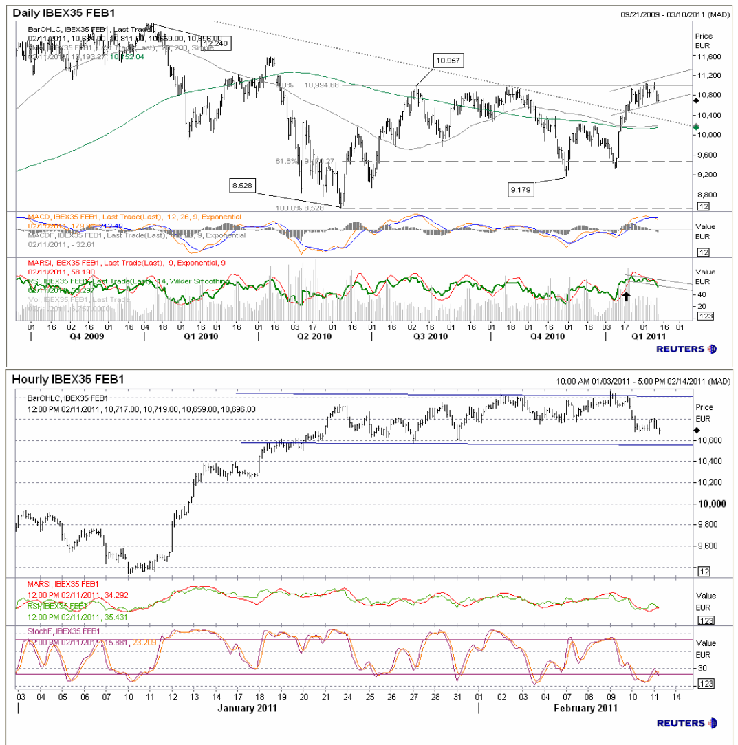
Futuro índice Ibx35 gráficos diario / horario.

Este planteamiento queda reflejado en nuestra estrategia para 2.011.