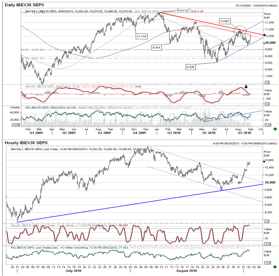
Gráfico horario: continúa la inercia positiva, dentro de un canal alcista con base 10.550 y techo en la zona de 11.000 puntos. La subida actual por encima de 10.770 genera divergencias bajistas, por lo que no damos demasiada fiabilidad a los movimientos de subida, esperando más una caída al menos hasta el soporte primero -10.550- aunque posiblemente la corrección tendría que ser algo mayor.

Futuro índice Ibox35 gráficos diario / horario.