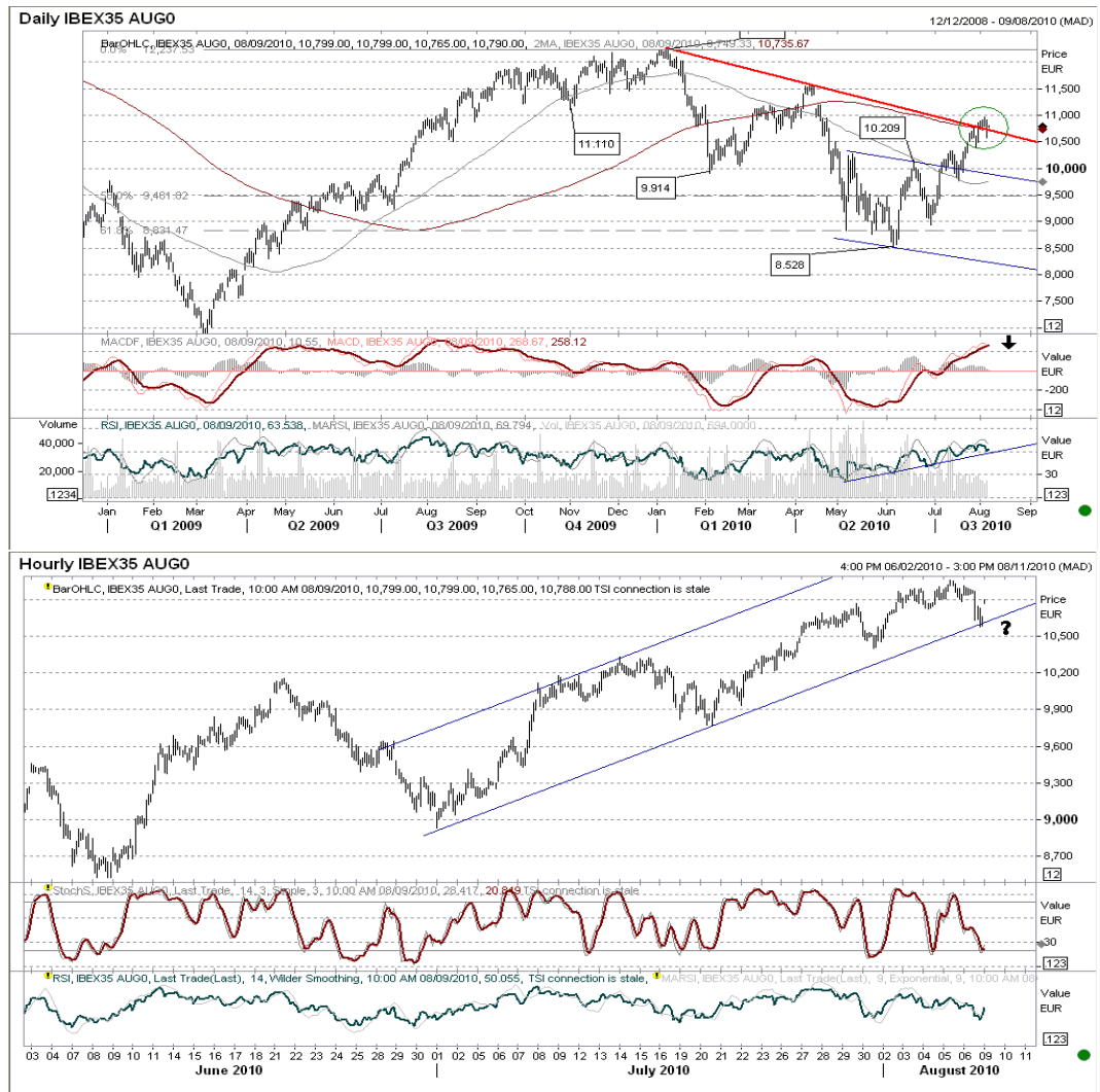
Gráfico del muy corto plazo: es significativo el canal alcista que dibujamos, por la presión sobre la base del mismo. Esperamos su ruptura –aprox. en 10.600- buscando el desarrollo de caída hasta la zona de 9.770 mínimo significativo de julio. Como alternativa, superando 11.000 puntos, desarrollo hasta el techo del canal 11.300.

Futuro índice Ibx35 gráficos diario / horario.