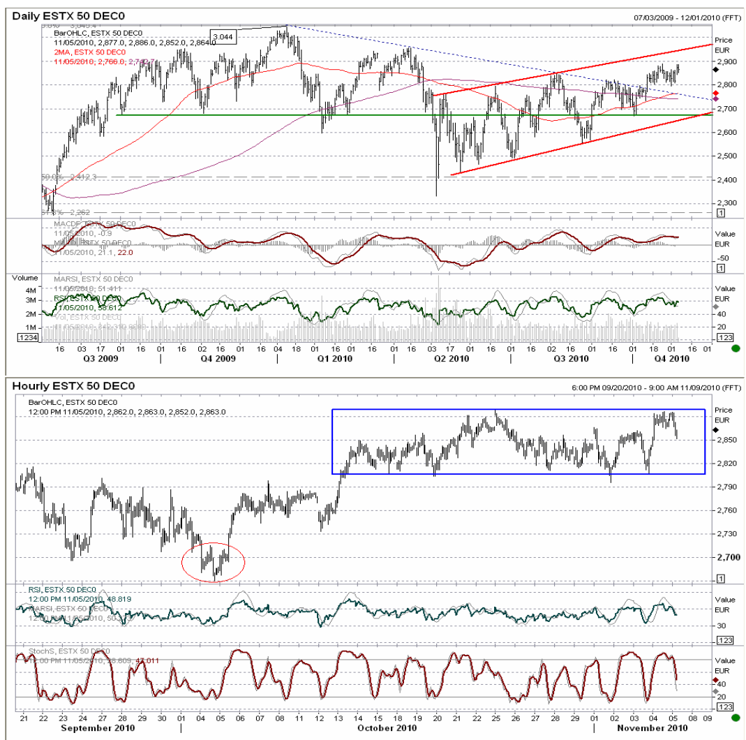
Futuro Eurostoxx50 gráficos diario / horario.

En el gráfico horario, hasta no romper la actual figura entre 2795 y 2890 mantengamos una posición neutral, aunque tras haber llegado al techo de la misma lo lógico sería buscar su base, 2.795, aunque sin esperar, de momento, una ruptura.