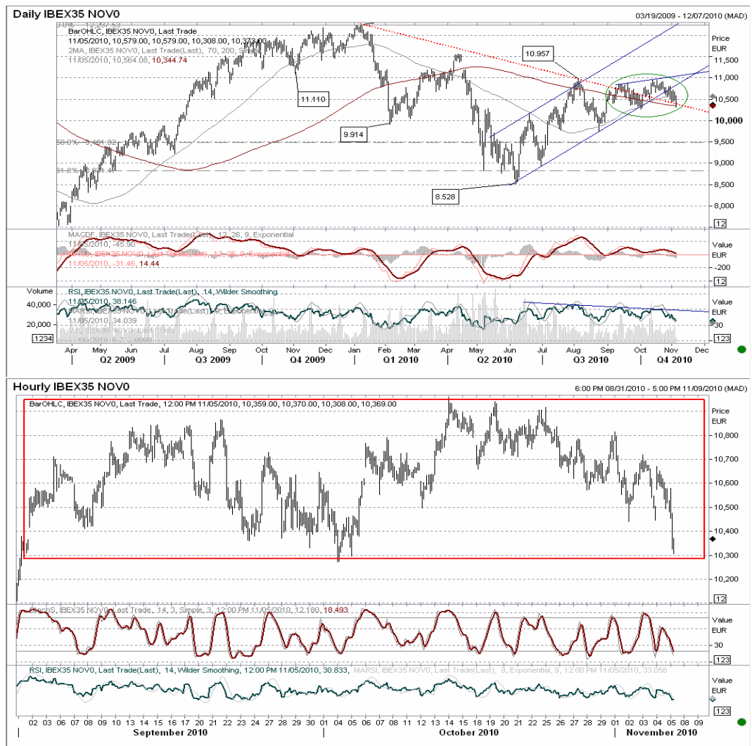
Gráfico horario: legamos a la base del rango que llevamos el aborando desde principios de septiembre, ya casi en sobreventa, por lo que no descartamos un rebote hasta 10.550. La pérdida de 10.300 debería llevarse a cabo tarde o temprano, y el primer nivel de proyección estaría en 10.040.

Futuro índice Ibx35 gráficos diario / horario.