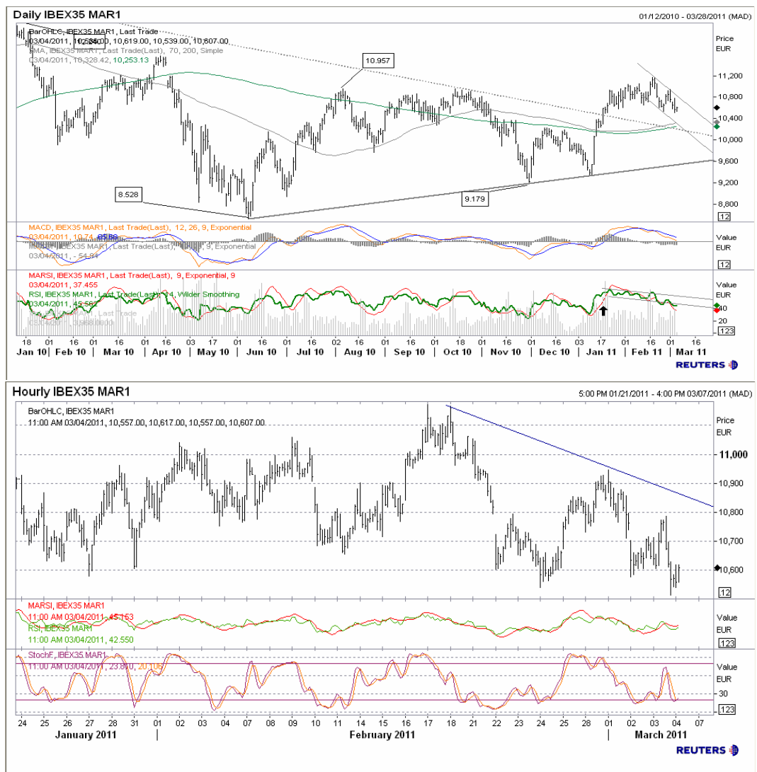
Futuro índice Ibx35 gráficos diario / horario.

En el muy corto plazo, vigilamos como resistencia 10.950 máximo anterior, nivel cuya ruptura desharía la mencionada serie de máximos y mínimos descendentes para volver a buscar los máximos del año. De todos modos, la figura del gráfico horario es negativa, y debería verse una ruptura más clara del soporte 10.550