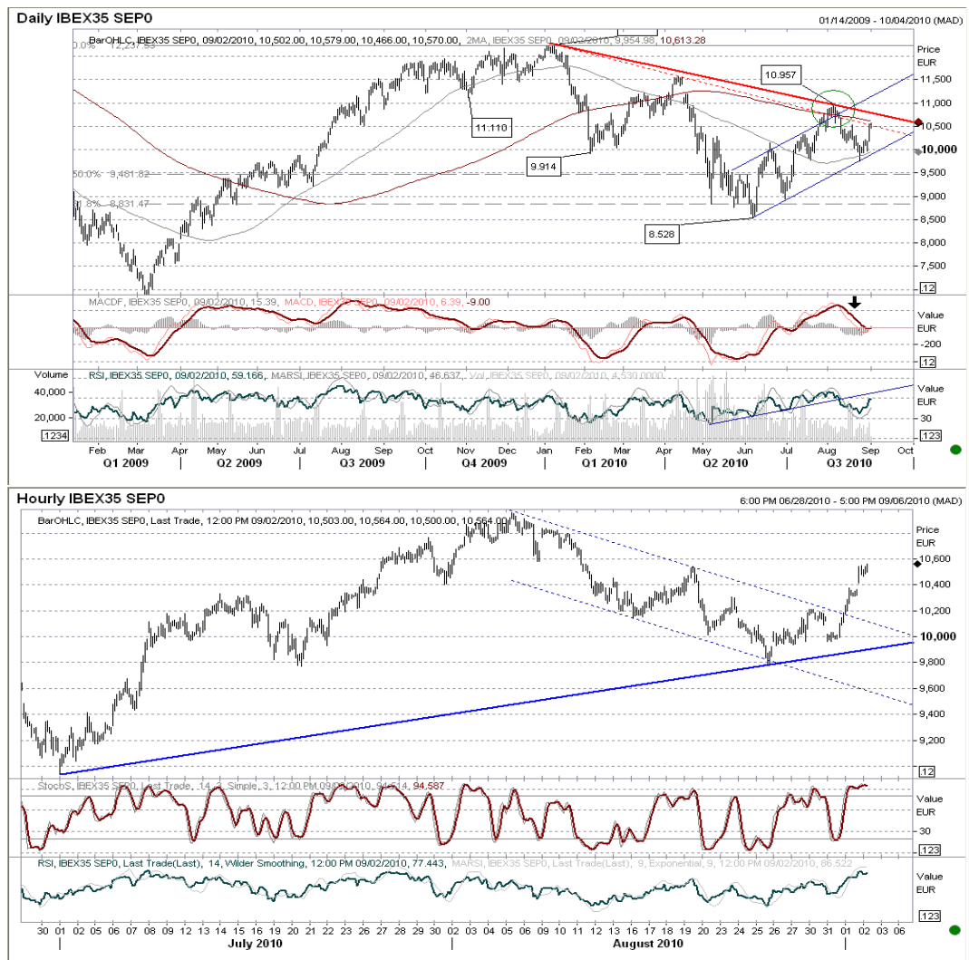
Gráfico del muy corto plazo: cumplido objetivo por encima de 10.550, tras la ruptura del canal bajista de agosto, y sobrecompra. De momento vemos difícil mucha mayor subida, por lo que en los niveles actuales lo prudente es esperar algún recorte hasta 10.200-10.300 antes de volver a plantera posiciones de compra. Vigilamos directriz alcista –trazo azul en gráfico inferior– como punto en donde aparecería una fuerte señal negativa.

Futuro índice Ibex35 gráficos diario / horario. Fuente: Reuters / Santander Investment Bolsa