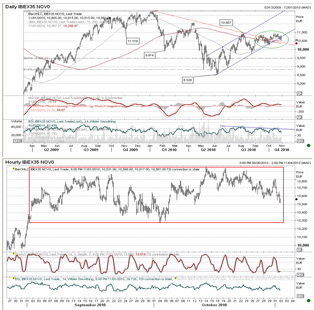
Gráfico horario: Seguimos dentro del mismo rango desde principios de septiembre, y todo apunta a buscar la base de este rango en torno a 10.300. Sin divergencias alcistas, los rebotes son oportunidades de venta.

Futuro índice Ibx35 gráficos diario / horario.